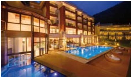
Aussenanlage Hotel | Meran