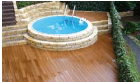
Privathaus | Dresden