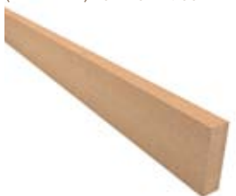
RESYSTA FPS 7020 ( B x H x L ) 70 x 20 x 2900 mm