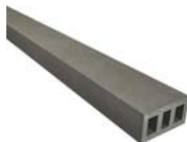
RESYSTA EC 1212 ( B x H x L ) 12 x 12 x 1450 mm