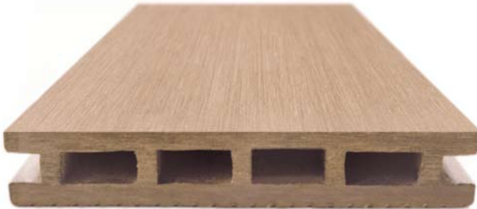
Oberfläche farblich unbehandelt

Resysta - The better wood - übertrifft sein natürliches Vorbild Tropenholz in fast jeder Hinsicht. Es ist wasserfest, splittert, quillt und reißt nicht und ist resistent gegen Pilz- und Tierbefall. Dabei ist es pflegeleicht, vielseitig in Farb- und Formgebung und zeichnet