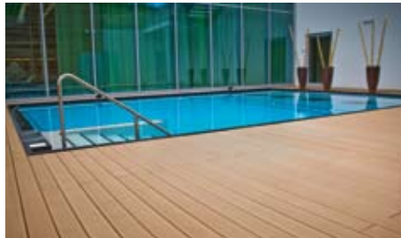
Hotelpool | Kitzbühl