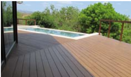
Golfclub | Kapstadt