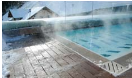
Aussenpool Hotel | Sölden