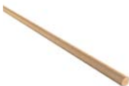
RESYSTA RR 12 ( B x H x L ) Ø 12 x 1000 mm