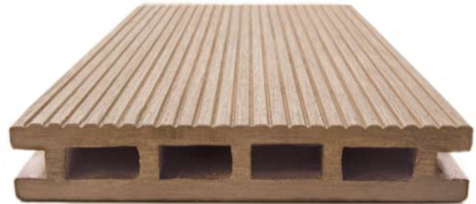
Oberfläche farblich unbehandelt

Umweltfreundliche Resysta Lasuren in verschiedenen Nuancen ermöglichen eine individuelle Farbgestaltung und bieten zusätzlichen Schutz und Pflege. Das Resysta Wendeprofil kann, wie der Name schon sagt, beidseitig