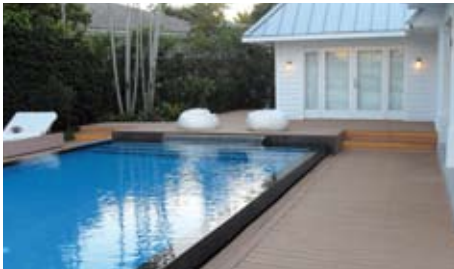
Private Villa | Key Biscane

Die Summe der besonderen Eigenschaften macht Resysta extrem widerstandsfähig gegen Witterungseinflüsse wie Sonne, Regen, Schnee, Eis, Salz- und Chlorwasser. Resysta quillt nicht, reißt nicht, splittert nicht und verrottet nicht. Darauf geben wir 15 Jahre Garantie.